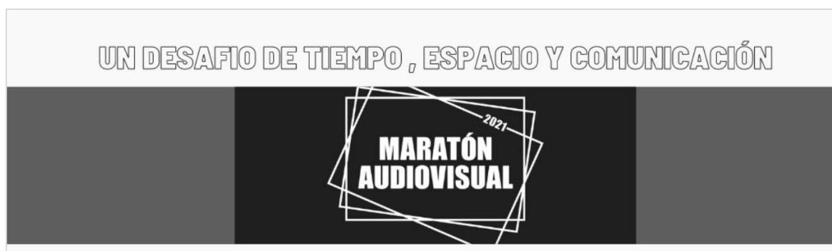
Figura 6. Logo e slogan do projeto